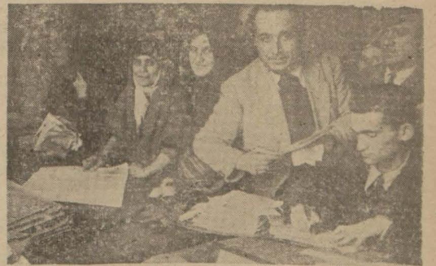
Nahiye müdürlüklerinden birinde karne tanzim ve tevzi faaliyeti

Bu yüzden nahiye müdürlüklerinin önü çok kalabalık oldu, bu işin bugün ikmal edileceği bildiriliyor