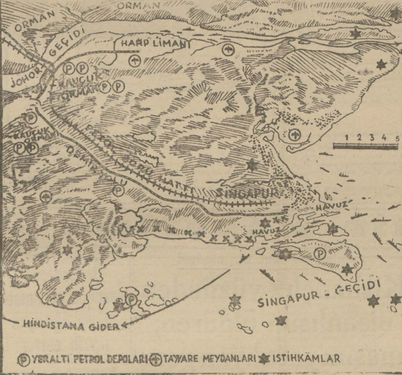
Uzaksarkin Cebelütârakı olan ve tahkimi için milyarlar harcanan Singapuru ve tahkimatını gösterir harita

26 Kânunusaniye kadar sürecek olan içtimala reis olarak Brezilya murahhası Bolivar seçilmiştir.